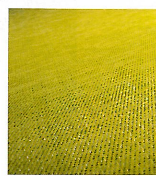
VEVD VINYL Gulv. Bolons vevde vinyl ser ut som et teppe, men legges som vinyl. Gulvet tåler vann, og er både sklisikkert og antistatisk. I tillegg er det like lett å vaske og støvsuge som andre gulvtyper. bolon.com .