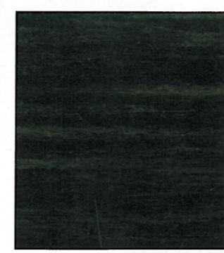
LINOLEUM. Ikke alle kan legge betonggulv. Da kan kanskje Armstrongs linoleum være et godt alternativ. Hva med denne varianten, som gir inntrykk av å være laget av stein, for eksempel? armstrong.com .

Generelt når vi velger gulv tenker vi på at materialene skal vare lenge og være slitesterke. Bruk og kastmentaliteten fungerer dårlig når man skal investere i gulv, det gjelder å velge et underlag som man kan leve med i lang tid fremover.