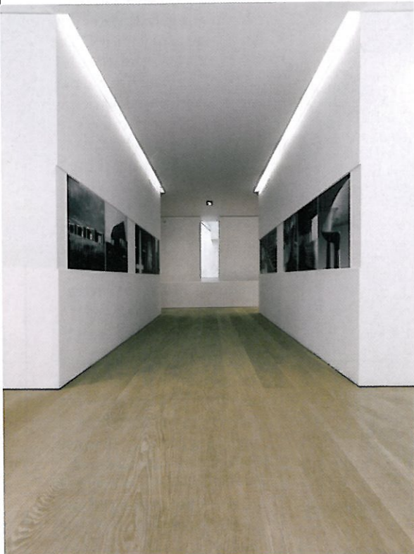
ÆRVERDIG. Dette Dinesen-gulvet er i eik, og er behandlet med hvit olje. Firmaet får levert tre fra europeiske skoger, og hvert tre er mellom 80 og 120 år gammelt. Med tiden får et heltregulv bare mer personlighet, men det kan også oljes og slipes for å få et nytt løft.