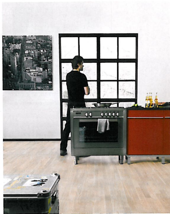
SVANEMERKET. Forshaga Parkett kommer i mange tresorter og er lett å legge selv.