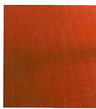
GUMMIGULV. Slitesterkt og holdbart fra engelske Artigo. Gulvet er mykt å gå på, og passer for eksempel bra til småbarnsfamilier. Fås i mange forskjellige knallfarger, og frisker opp ethvert rom. artigo.com .